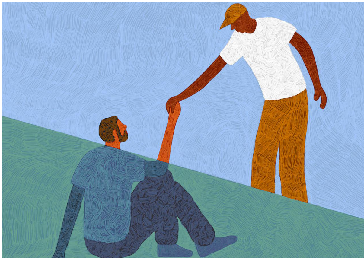
Illustratie Sjoerd van Leeuwen